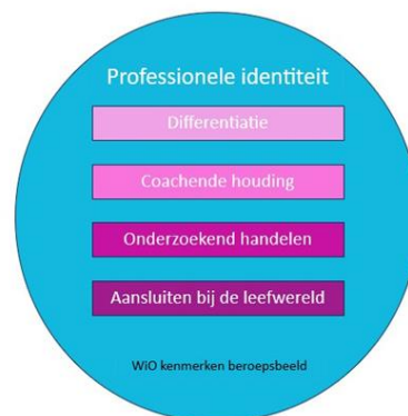
Afbeelding 3. Schematische weergave kernpuntenvoorkant (Jansen, H. en De Booij, A., 2022).